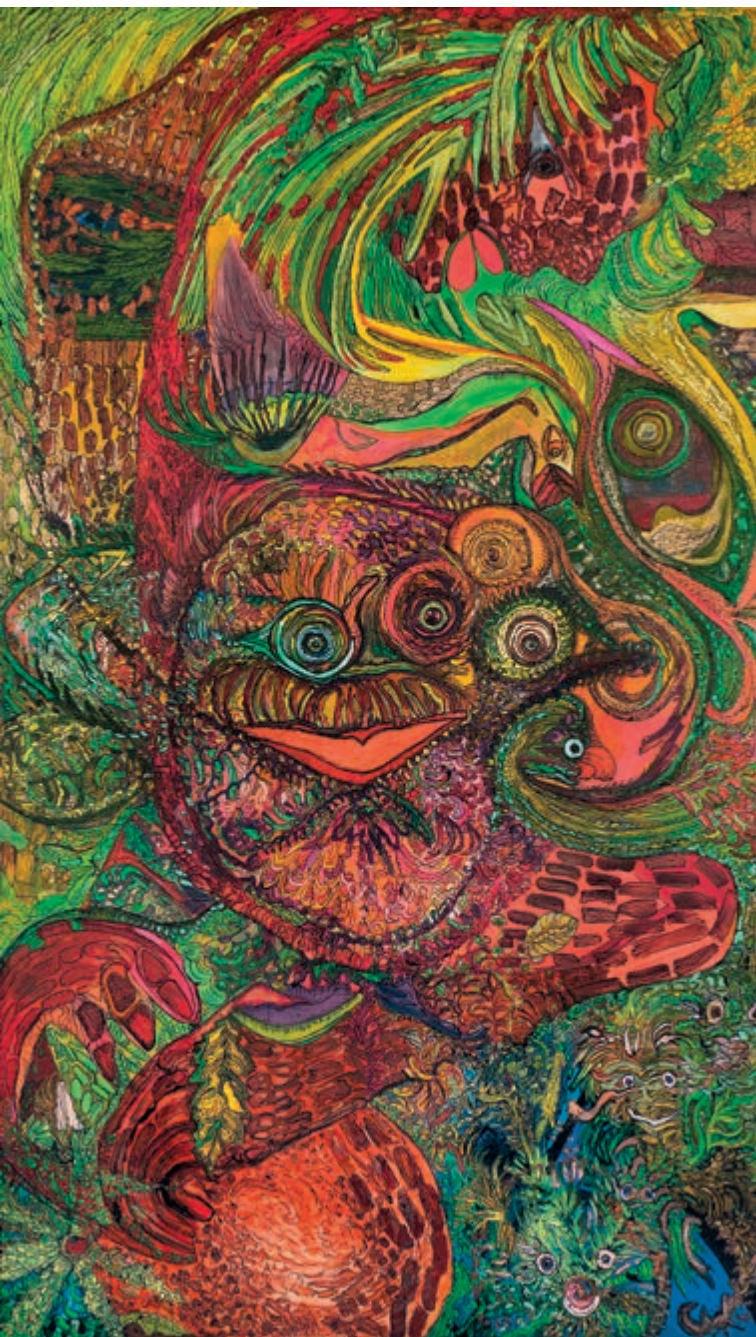
Ody Saban, L'oursin magnétique d'une petite fleur de la nuit 195 x 114 cm, Acryl, Tusche auf Leinwand, 2012