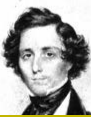
Felix Mendelssohn Bartholdy