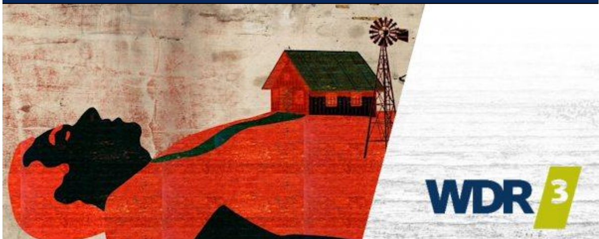
WDR 3 Hörspiel Roter Staub